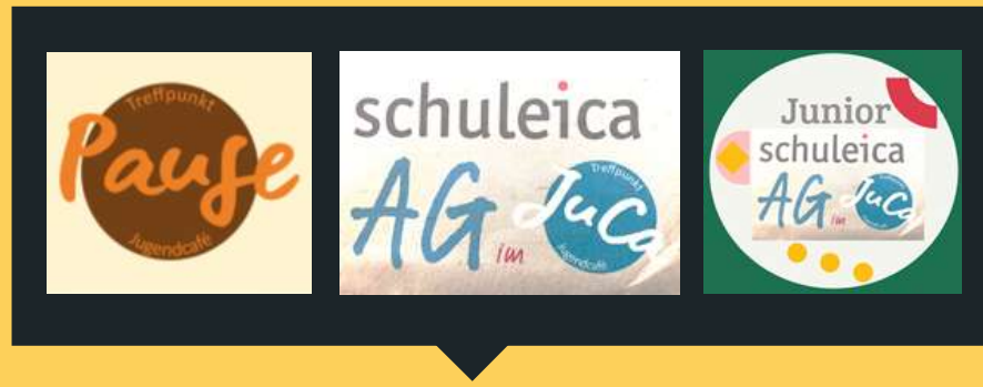
Kooperationen mit der anliegenden Hauptschule