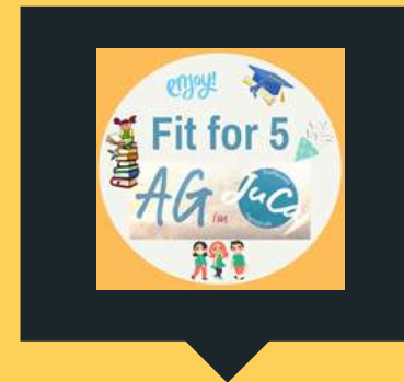
Kooperation mit der anliegenden Grundschule & OGS