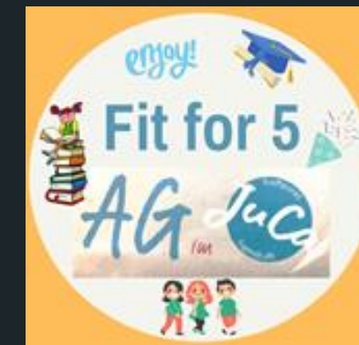
Kooperation mit der anliegenden Grundschule & OGS