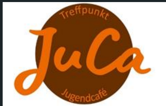
Mobile Offene Tür