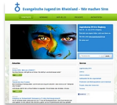
Website des Jugendverbandes