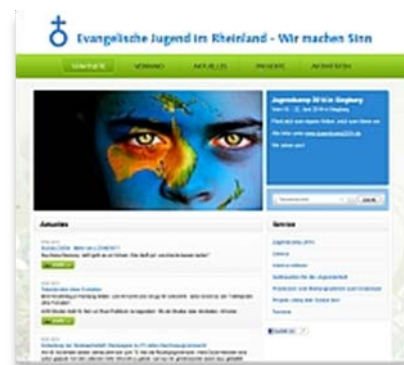
Website des Jugendverbandes