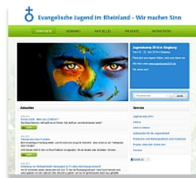
Website des Jugendverbandes