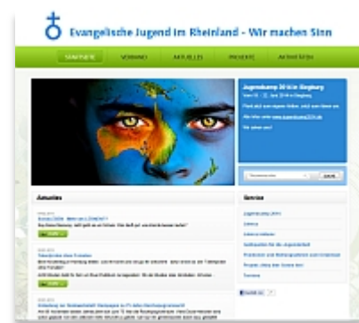
Website des Jugendverbandes