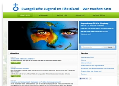
Verband der Evangelischen Jugend im Rheinland